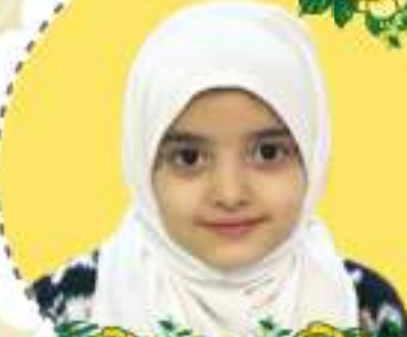
فرح نجاح حسه