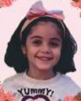
أفناه عقيل شاك